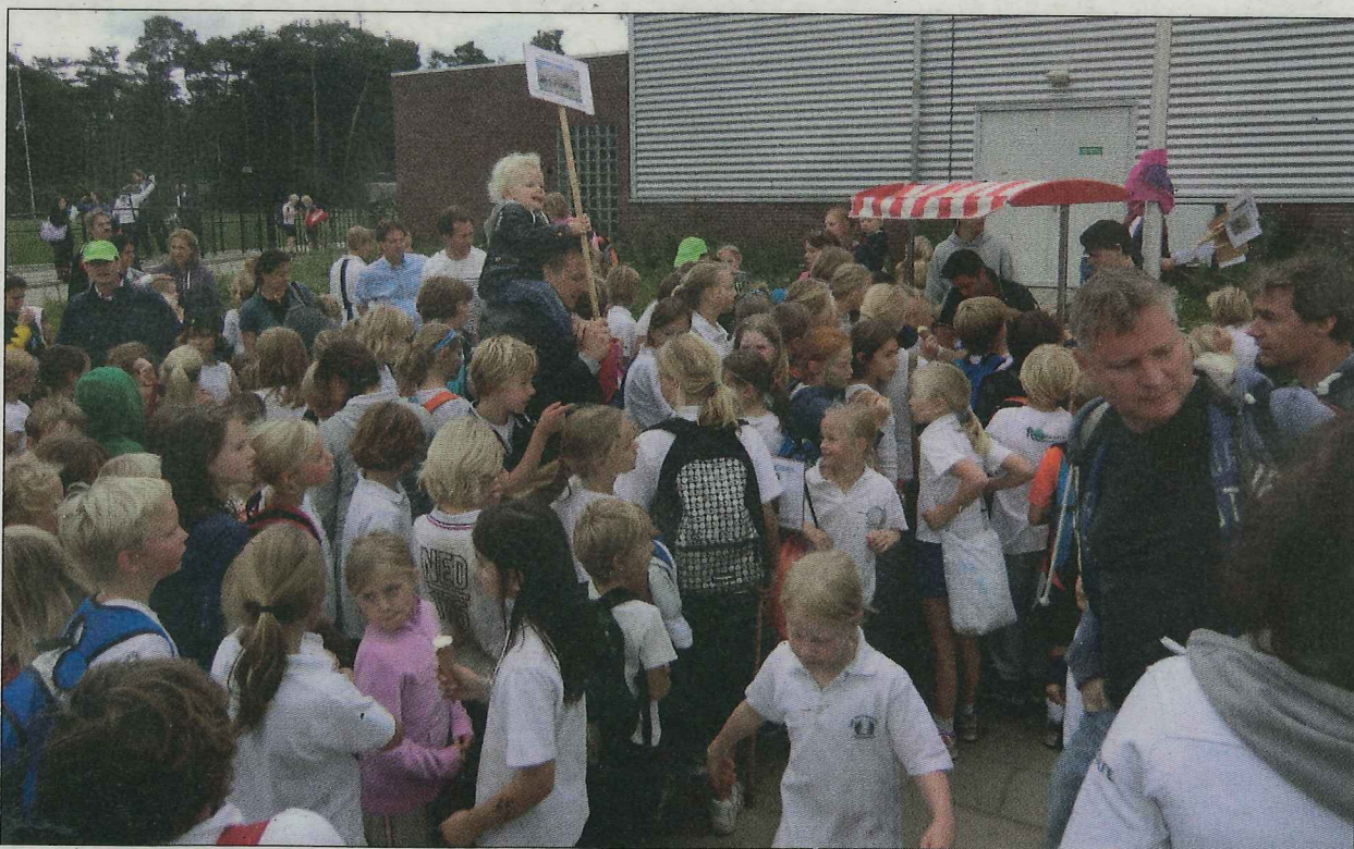
De sportdag op de Van Dijckschool werd afgesloten bij de ijskar die speciaal naar het sportveld was gekomen.